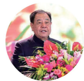
有新发现才有新发展 ——艾丰 权威品牌专家