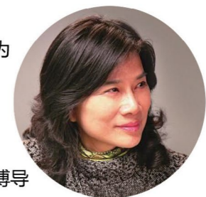
让中国品牌 走向世界 ——董明珠 格力集团董事长