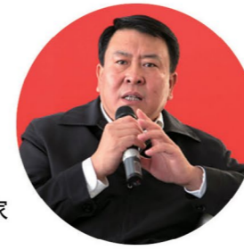
关注对话品牌 唱响自主创新 ——徐和谊 北汽集团董事长