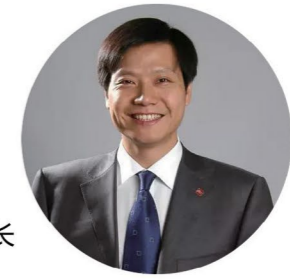
用心做品牌 让产品说话 ——雷军 小米创始人